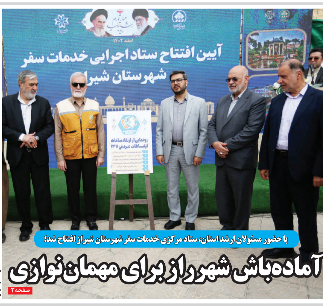
با حضور مسئولان ارشد استان، ستاد مرکزی خدمات شیراز افتتاح شد

آماده باشی شهر را از برای مهمان نوازی مدیر عامل توزیع نیروی برق استان فارس خبر داد: افزایش ۷۰ درصدی کشفیات ماینر مدیر کل میراث فرهنگی، گردشگری و صنایع دستی فارس تأکید کرد: سامان دهی و ارتقای کیفیت خانه های مسافر معاون گردشگری و زیارت استانداری فارس مطرح کرد: فارس مهیای میزبانی نوروز