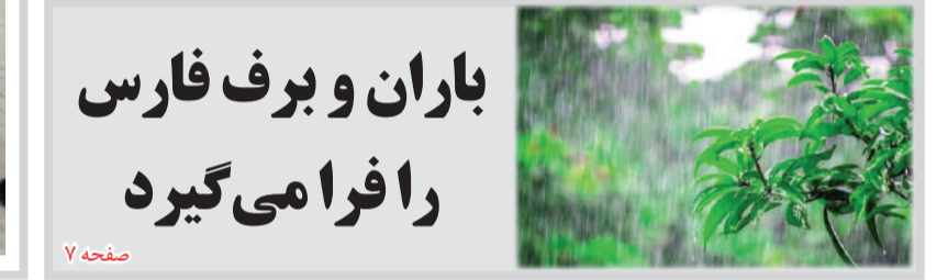
باران و برف فارس را فرامی گیرد