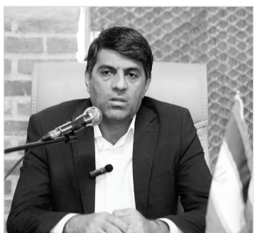
مدیرکل میراث‌فرهنگی، گردشگری و صنایع‌دستی استان فارس

یگان حفاظت اداره کل میراث‌فرهنگی فارس نیروی وظیفه امریه می‌پذیرد